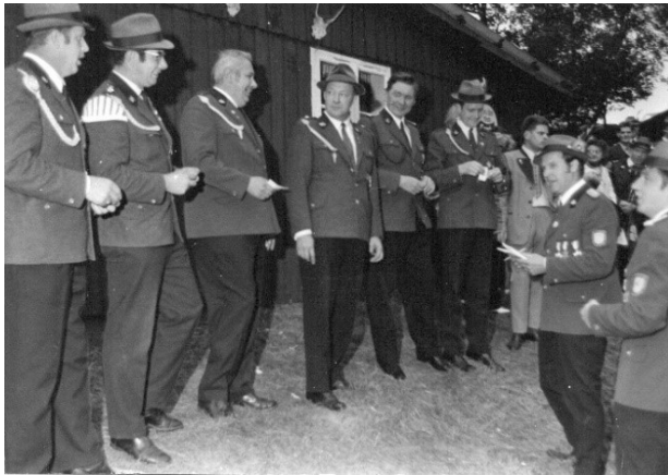
Proklamation 1971 - 6 Schützen müssen ins Stechen