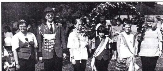
Geschmückt mit einem Blumenbogen: Jelmstorf's neue Kinderkönige mit den Majestäten