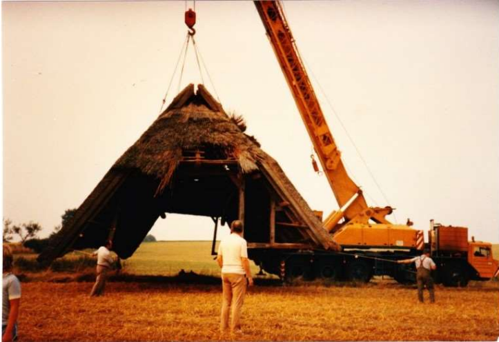
Umsetzung des Schafstalls am 19.08.1983