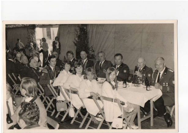
Schützenbrüder und Schützenschwestern 1971