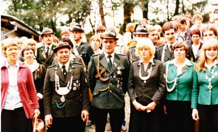
Majestäten 1981 [von links]