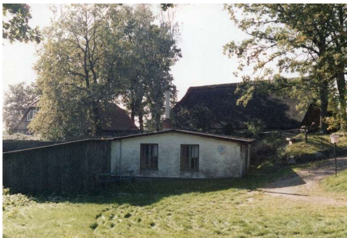
Schießstand um 1990