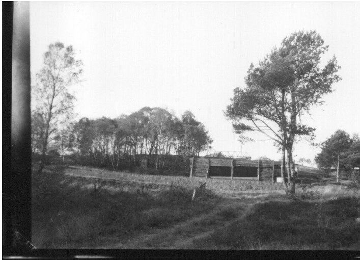
Scheibenstand um 1927