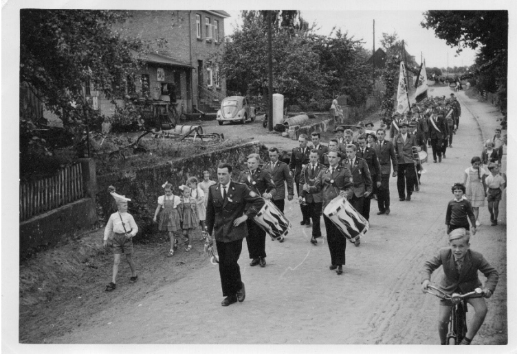
Festumzug 1959 in der Rackerstraße erstmals mit dem Fanfarenzug