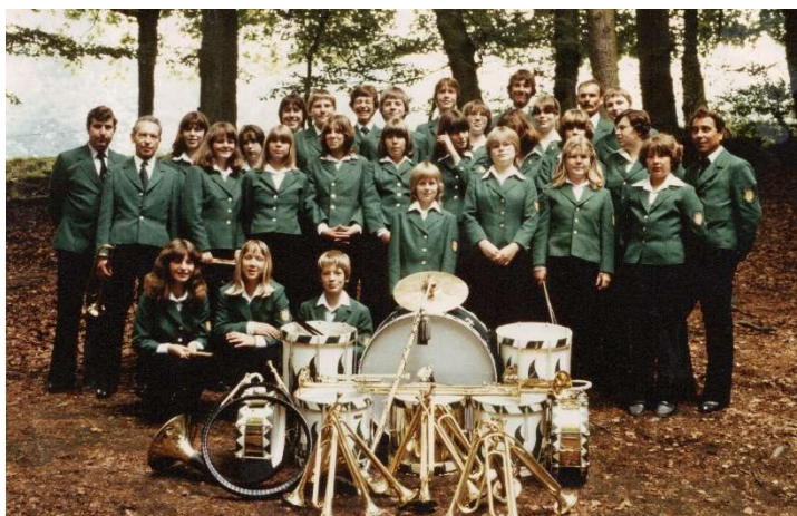
Fanfarenzug beim Schützenfest 1981