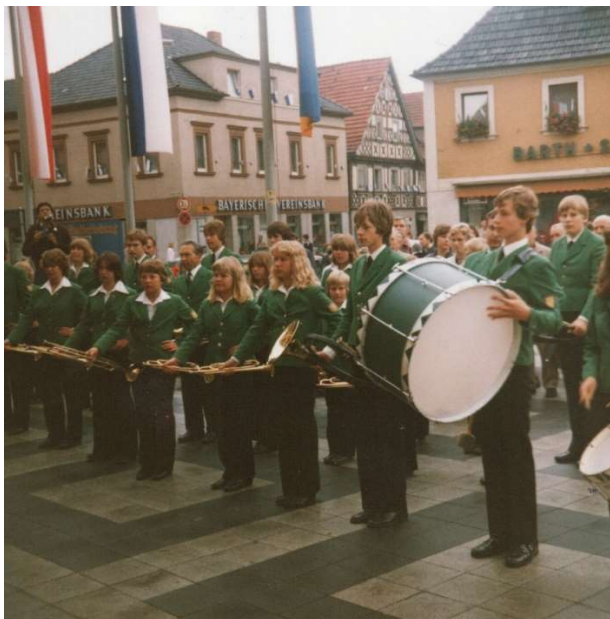
Auftritt 1981 auf dem Lichtenfelser Rathausplatz