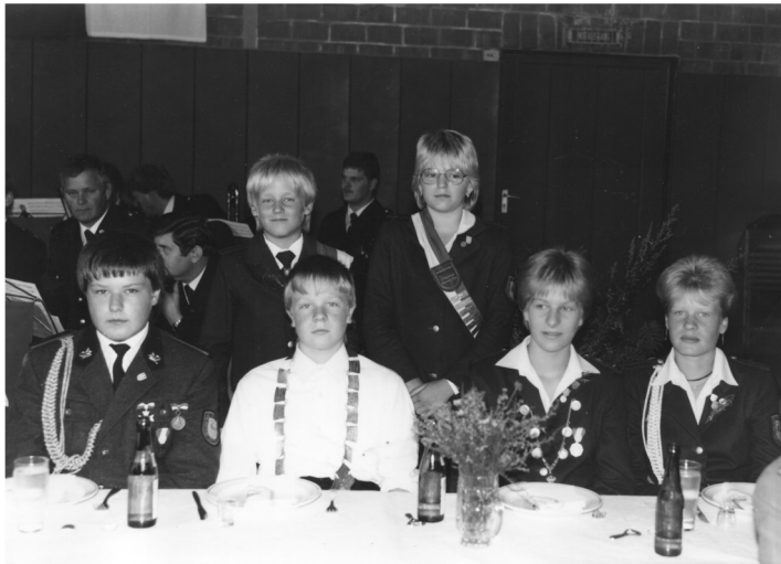
Kinder- und Jugendmajestäten 1985